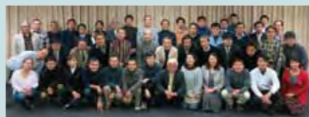
NPO法人 持続可能なまちと交通をめざす再生塾

活動の軸は「人づくり」です。まちづくりや交通に携わる学識経験者、行政関係者、技術者の有志らが相互に連携しながら、それぞれが専門とする技術や経験をもとに、各地域でまちづくりと交通政策に関わる行政団体、企業等の実務者や地域住民のみなさまを実践的に支援するべく、これらの方々を対象とした塾(セミナー)や研修活動を積極的に展開しています。