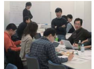
ラーニング・ファシリテーターが参加者の発言、議論をサポート