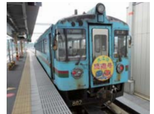
KTR北近畿タンゴ鉄道 現地調査（2011）