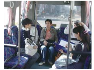
大阪市交通局「赤バス」現地調査（2008）