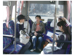
大阪市交通局「赤バス」現地調査(2008)