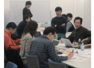
ラーニング・ファシリテーターが参加者の発想、議論をサポート