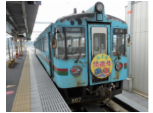
KTR北近畿タンゴ鉄道 現地調査(2011)